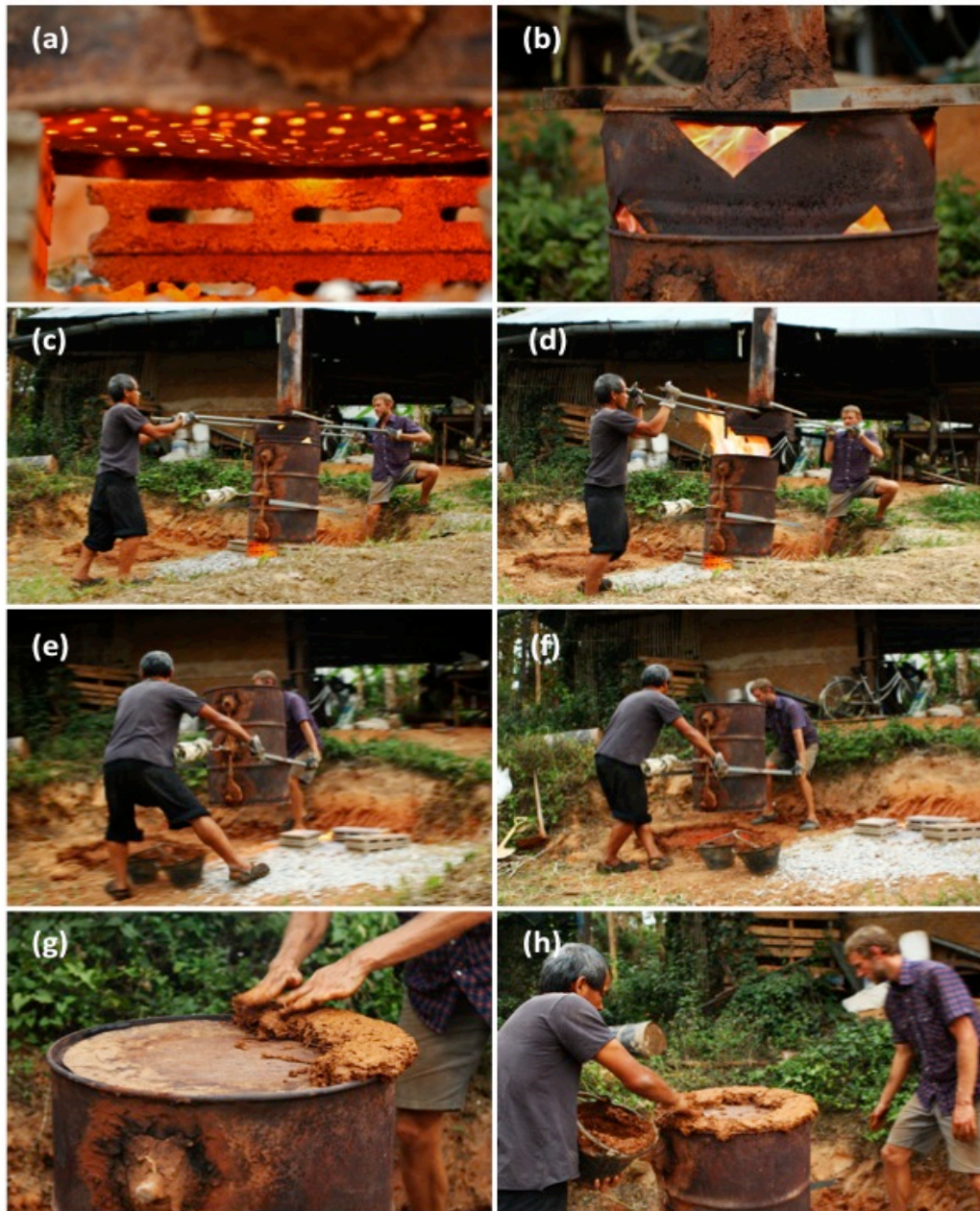
Fotos que muestra el procedimiento de apagado: El fondo del barril empieza a brillar (a) y las llamas azules aparecen en la corona (b), entonces pirólisis está casi terminado. Retire la corona y la chimenea (c) y (d) poner la tapa y mover el cuerpo de reactor a la fosa de lodo al lado para sellar la parte inferior (e) y (f) sellar la parte superior con barro para prevenir fugas de aire (g) y (h).